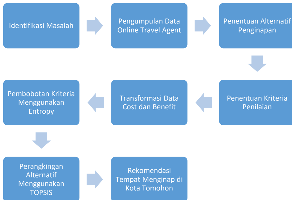
Gambar 1. Kerangka Penelitian Entropy-TOPSIS model

Tahapan penelitian dimulai dari identifikasi masalah, pengumpulan data, penentuan alternatif, penentuan kriteria, transformasi data, pembobotan menggunakan Entropy, perankingan menggunakan TOPSIS, dan penyusunan rekomendasi.