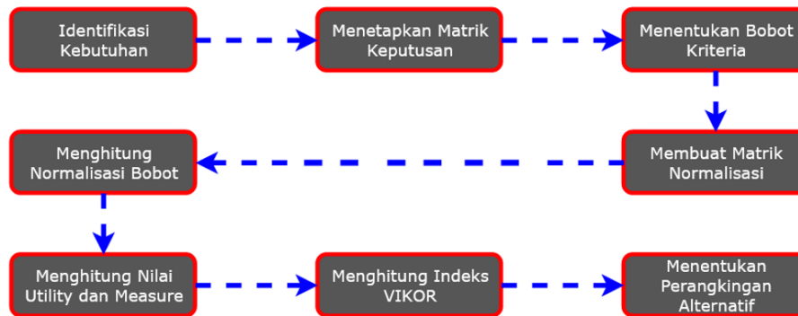
Gambar 1. Alur Kerangka Penelitian

Metode penelitian merupakan suatu teknik atau proses dalam pemecahan masalah yang dilakukan secara berurutan dan sistematis untuk mendapatkan solusi dari permasalahan yang ada[13]–[15]. Alur kerangka penelitian yang dilakukan dapat dilihat pada Gambar 1.