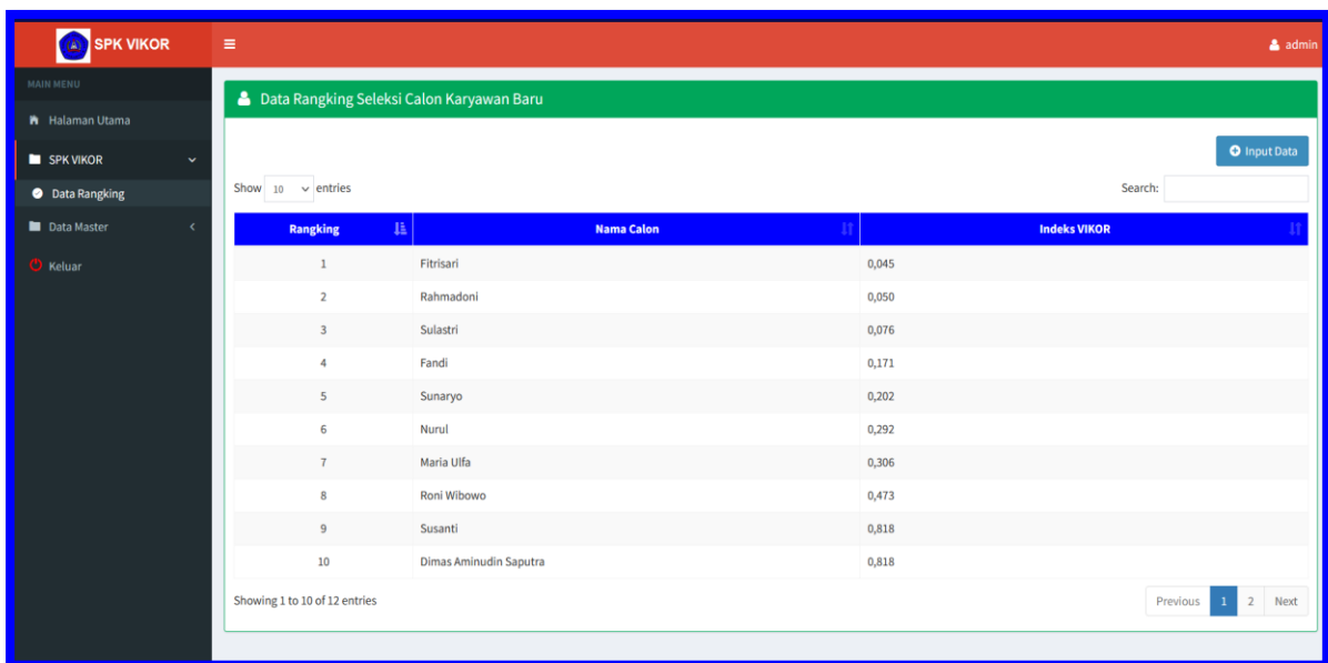
Gambar 3. Tampilan Aplikasi Halaman Ranking Calon Karyawan Baru

Halaman login berfungsi sebagai halaman pertama yang akan tampil ketika pengguna mengakses aplikasi sistem pendukung keputusan penerimaan karyawan baru. Dalam halaman login pengguna harus memasukkan username dan password sebagai bentuk validasi untuk mengakses semua menu yang tersedia dalam aplikasi. Tampilan halaman ranking hasil seleksi penerimaan karyawan baru dapat dilihat pada Gambar 3.